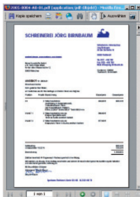
Angebot mit hinterlegtem Firmenbriefbogen im PDF-Format