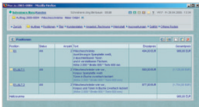
Positionsübersicht eines Auftrags für die Fakturierung

Weitere Arbeitsplätze im Betrieb werden per Netzwerkkabel oder Funknetz (WLAN) mit dem Webserver-PC verbunden und greifen auf dessen Programme und Daten zu.